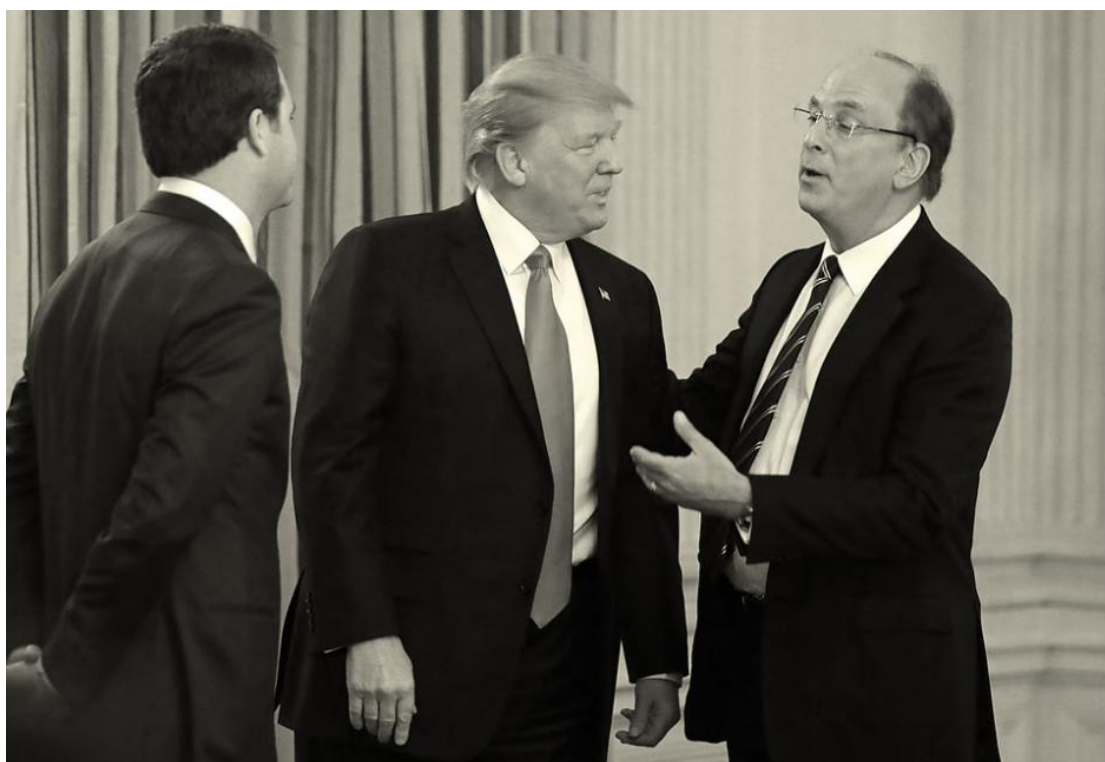
2017 a Fehér Házban

Utazásai azt is lehetővé teszik Fink számára, hogy hódoljon a névsor-növelés szenvedélyének, amit inkább pletykaként, mint hencegésként tesz. Hallani lehet tőle, hogyan tárgyalt a Brexitről egy brit miniszterelnökkel, vagy hogyan kötött személyes barátságot Andrés Manuel López Obradorral, Mexikó erősen elitellenes baloldali elnökével. Fink nem válogat abban, hogy kivel kerül közel. Ő volt az egyik első New York-i pénzember, aki kijelentette, hogy nem szakítja meg a kapcsolatot Szaúd-Arábiával a Washington Post kolumnistájának, Dzsamál Khashogginak a meggyilkolása után. "Az utolsó dolog, amit megtenne, hogy nem beszélget az emberekkel, még akkor sem, ha az kellemetlen" - mondja Fairbairn. David Rubenstein, a Carlyle Group magántőke-befektetési cég társelnöke szerint Fink tekintélye a globális pénzügyi körökben nagyobb, mint sok kormányminiszteré. "Gyakorlatilag a pénzügyminisztérium globális miniszterévé vált, hivatalos cím nélkül" – viccelődik.